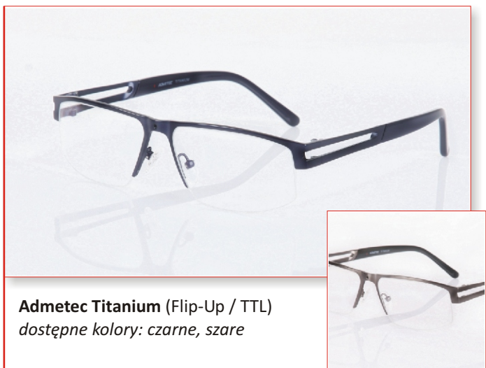
Admetec Titanium (Flip-Up / TTL) dostępne kolory: czarne, szare

Lupy Flip-Up montowane są na eleganckich i trwałych oprawkach tytanowych Admetec i Admetec S .