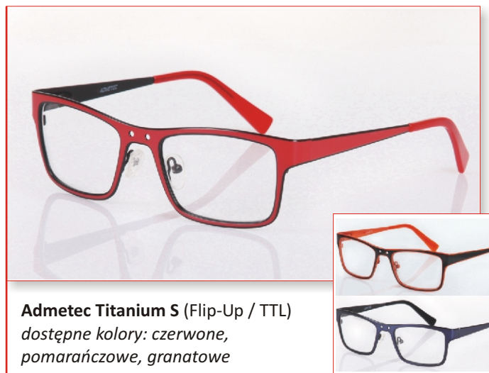
Admetec Titanium S (Flip-Up / TTL) dostępne kolory: czerwone, pomarańczowe, granatowe